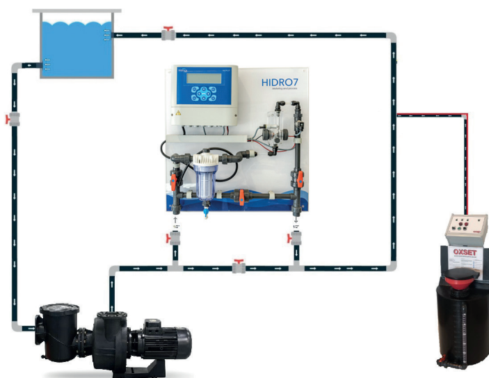
Esquema para agua de consumo